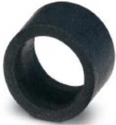
Cable seal Pg9, for SC-RJ/IP67 sleeve housing

Please be informed that the data shown in this PDF Document is generated from our Online Catalog. Please find the complete data in the user's documentation. Our General Terms of Use for Downloads are valid ( http://phoenixcontact.com/download )