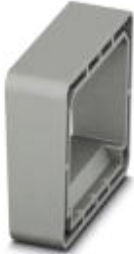
Spacer plate for PLW 16-6/3 feed-through terminal block

Please be informed that the data shown in this PDF Document is generated from our Online Catalog. Please find the complete data in the user's documentation. Our General Terms of Use for Downloads are valid ( http://phoenixcontact.com/download )