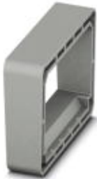
Spacer plate for PLW 16-6/4 feed-through terminal block

Please be informed that the data shown in this PDF Document is generated from our Online Catalog. Please find the complete data in the user's documentation. Our General Terms of Use for Downloads are valid ( http://phoenixcontact.com/download )