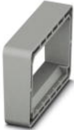
Spacer plate for PLW 16-6/5 feed-through terminal block

Please be informed that the data shown in this PDF Document is generated from our Online Catalog. Please find the complete data in the user's documentation. Our General Terms of Use for Downloads are valid ( http://phoenixcontact.com/download )