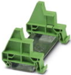
DIN rail adapter, for snapping the PC 16/IPC 16 connector onto a DIN rail, color: green, mounting type: NS 35/7,5, NS 35/15

Please be informed that the data shown in this PDF Document is generated from our Online Catalog. Please find the complete data in the user's documentation. Our General Terms of Use for Downloads are valid ( http://phoenixcontact.com/download )