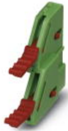
Ejectors, for assembly on each side of the header

Please be informed that the data shown in this PDF Document is generated from our Online Catalog. Please find the complete data in the user's documentation. Our General Terms of Use for Downloads are valid ( http://phoenixcontact.com/download )