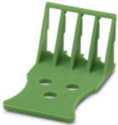
Strain relief for snapping into the latching chambers of the plugs, 4-pos.

Please be informed that the data shown in this PDF Document is generated from our Online Catalog. Please find the complete data in the user's documentation. Our General Terms of Use for Downloads are valid ( http://phoenixcontact.com/download )