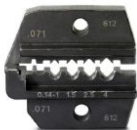
Replacement die for crimping pliers CRIMPFOX-1,6/2,5-ED-4,0

Please be informed that the data shown in this PDF Document is generated from our Online Catalog. Please find the complete data in the user's documentation. Our General Terms of Use for Downloads are valid ( http://phoenixcontact.com/download )