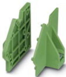
Pair of flanges, can be snapped onto a row of single terminal blocks

Please be informed that the data shown in this PDF Document is generated from our Online Catalog. Please find the complete data in the user's documentation. Our General Terms of Use for Downloads are valid ( http://phoenixcontact.com/download )