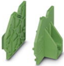
Pair of flanges, can be snapped onto a row of single terminal blocks

Please be informed that the data shown in this PDF Document is generated from our Online Catalog. Please find the complete data in the user's documentation. Our General Terms of Use for Downloads are valid ( http://phoenixcontact.com/download )