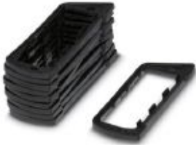
EMC seal for HC-ALU panel mounting base

Please be informed that the data shown in this PDF Document is generated from our Online Catalog. Please find the complete data in the user's documentation. Our General Terms of Use for Downloads are valid ( http://phoenixcontact.com/download )