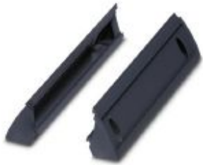
Mounting foot for panel mounting the HC-ALU panel mounting base

Please be informed that the data shown in this PDF Document is generated from our Online Catalog. Please find the complete data in the user's documentation. Our General Terms of Use for Downloads are valid ( http://phoenixcontact.com/download )