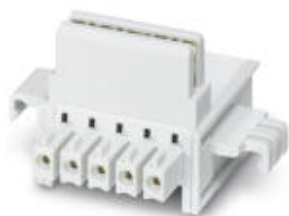
Bus connector to connect ME-MAX modules on the DIN rail; suitable for ME-MAX DEV-KITS; contains ME 22,5 TBUS 1,5/ 5

Please be informed that the data shown in this PDF Document is generated from our Online Catalog. Please find the complete data in the user's documentation. Our General Terms of Use for Downloads are valid ( http://phoenixcontact.com/download )