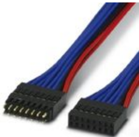
Cable bridge for cross-DIN-rail connection of the HBUS connector

Please be informed that the data shown in this PDF Document is generated from our Online Catalog. Please find the complete data in the user's documentation. Our General Terms of Use for Downloads are valid ( http://phoenixcontact.com/download )