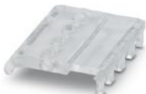
Ejector for COMBICON plug

Please be informed that the data shown in this PDF Document is generated from our Online Catalog. Please find the complete data in the user's documentation. Our General Terms of Use for Downloads are valid ( http://phoenixcontact.com/download )