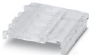
Ejector for COMBICON plug

Please be informed that the data shown in this PDF Document is generated from our Online Catalog. Please find the complete data in the user's documentation. Our General Terms of Use for Downloads are valid ( http://phoenixcontact.com/download )