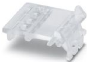
Ejector for COMBICON plug

Please be informed that the data shown in this PDF Document is generated from our Online Catalog. Please find the complete data in the user's documentation. Our General Terms of Use for Downloads are valid ( http://phoenixcontact.com/download )