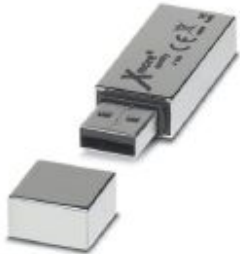
USB memory stick, 8 GB

Please be informed that the data shown in this PDF Document is generated from our Online Catalog. Please find the complete data in the user's documentation. Our General Terms of Use for Downloads are valid ( http://phoenixcontact.com/download )