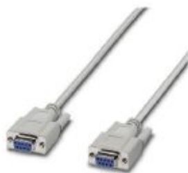
RS-232 cable, 9-pos. D-SUB socket on 9-pos. D-SUB socket, 9-wire, 1:1

Please be informed that the data shown in this PDF Document is generated from our Online Catalog. Please find the complete data in the user's documentation. Our General Terms of Use for Downloads are valid ( http://phoenixcontact.com/download )