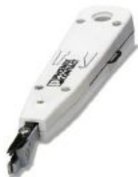
Split-core tool for connecting cables to LSA-Plus strips

Please be informed that the data shown in this PDF Document is generated from our Online Catalog. Please find the complete data in the user's documentation. Our General Terms of Use for Downloads are valid ( http://phoenixcontact.com/download )