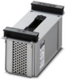
TRABTECH test adapter, for testing the function of VALVETRAB

Please be informed that the data shown in this PDF Document is generated from our Online Catalog. Please find the complete data in the user's documentation. Our General Terms of Use for Downloads are valid ( http://phoenixcontact.com/download )