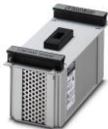
Test adapter for COMTRAB-CTM

Please be informed that the data shown in this PDF Document is generated from our Online Catalog. Please find the complete data in the user's documentation. Our General Terms of Use for Downloads are valid ( http://phoenixcontact.com/download )