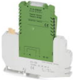
Bridging module, for bridging input and output circuit

Please be informed that the data shown in this PDF Document is generated from our Online Catalog. Please find the complete data in the user's documentation. Our General Terms of Use for Downloads are valid ( http://phoenixcontact.com/download )