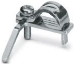
Shield connection clamp for printed circuit terminal block

Please be informed that the data shown in this PDF Document is generated from our Online Catalog. Please find the complete data in the user's documentation. Our General Terms of Use for Downloads are valid ( http://phoenixcontact.com/download )