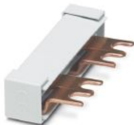
Wiring bridge for modules with connecting pitch 17.5 mm, 2-phase, 4-pos.

Please be informed that the data shown in this PDF Document is generated from our Online Catalog. Please find the complete data in the user's documentation. Our General Terms of Use for Downloads are valid ( http://phoenixcontact.com/download )