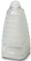
Accessories, IP54 protection for patch cable, use with FL IP54 FLANGE ...

Please be informed that the data shown in this PDF Document is generated from our Online Catalog. Please find the complete data in the user's documentation. Our General Terms of Use for Downloads are valid ( http://phoenixcontact.com/download )