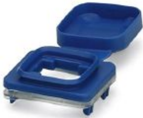
IP54 protection with color marking for SFN switch and angled patch connector, blue

Please be informed that the data shown in this PDF Document is generated from our Online Catalog. Please find the complete data in the user's documentation. Our General Terms of Use for Downloads are valid ( http://phoenixcontact.com/download )