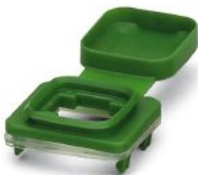
IP54 protection with color marking for SFN switch and angled patch connector, green

Please be informed that the data shown in this PDF Document is generated from our Online Catalog. Please find the complete data in the user's documentation. Our General Terms of Use for Downloads are valid ( http://phoenixcontact.com/download )