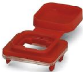
IP54 protection with color marking for SFN switch and angled patch connector, red

Please be informed that the data shown in this PDF Document is generated from our Online Catalog. Please find the complete data in the user's documentation. Our General Terms of Use for Downloads are valid ( http://phoenixcontact.com/download )