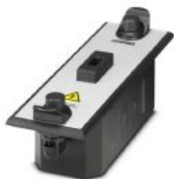
CHECKMASTER 2 test adapter for the CTM product range

Please be informed that the data shown in this PDF Document is generated from our Online Catalog. Please find the complete data in the user's documentation. Our General Terms of Use for Downloads are valid ( http://phoenixcontact.com/download )