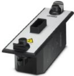
CHECKMASTER 2 test adapter for the PT and PLT-SEC product ranges, 17.5 mm

Please be informed that the data shown in this PDF Document is generated from our Online Catalog. Please find the complete data in the user's documentation. Our General Terms of Use for Downloads are valid ( http://phoenixcontact.com/download )