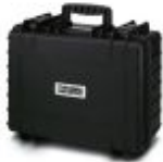
Transport case for accommodating 4 TRABTECH CM 2-PA... test adapters