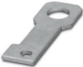
Plate for fixing the FLT-ISG-100-EX isolating spark gap to a flange, drill hole diameter of 22 mm.

Please be informed that the data shown in this PDF Document is generated from our Online Catalog. Please find the complete data in the user's documentation. Our General Terms of Use for Downloads are valid ( http://phoenixcontact.com/download )