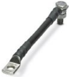
Connecting cable for FLT-ISG-100-EX, length 100 mm.

Please be informed that the data shown in this PDF Document is generated from our Online Catalog. Please find the complete data in the user's documentation. Our General Terms of Use for Downloads are valid ( http://phoenixcontact.com/download )