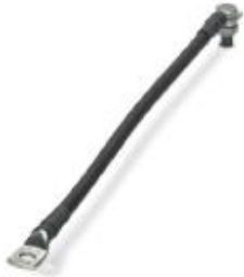
Connecting cable for FLT-ISG-100-EX, length 300 mm.

Please be informed that the data shown in this PDF Document is generated from our Online Catalog. Please find the complete data in the user's documentation. Our General Terms of Use for Downloads are valid ( http://phoenixcontact.com/download )