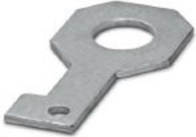
Plate for fixing the FLT-ISG-100-EX isolating spark gap to a flange, drill hole diameter of 33 mm.

Please be informed that the data shown in this PDF Document is generated from our Online Catalog. Please find the complete data in the user's documentation. Our General Terms of Use for Downloads are valid ( http://phoenixcontact.com/download )