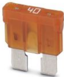
Fuse, nominal current: 40 A, length: 19 mm, width: 5 mm, height: 18.8 mm

Please be informed that the data shown in this PDF Document is generated from our Online Catalog. Please find the complete data in the user's documentation. Our General Terms of Use for Downloads are valid ( http://phoenixcontact.com/download )