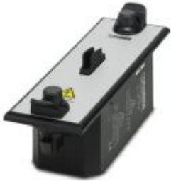
CHECKMASTER 2 test adapter for the TTC product range.

Please be informed that the data shown in this PDF Document is generated from our Online Catalog. Please find the complete data in the user's documentation. Our General Terms of Use for Downloads are valid ( http://phoenixcontact.com/download )