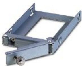
Removable hard drive tray for Valueline IPC

Please be informed that the data shown in this PDF Document is generated from our Online Catalog. Please find the complete data in the user's documentation. Our General Terms of Use for Downloads are valid ( http://phoenixcontact.com/download )