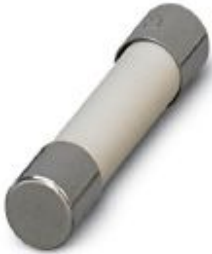
Output fuse (5x20 mm) acc. to IEC 127-2/EN 60127-2, 2 A fast blow

Please be informed that the data shown in this PDF Document is generated from our Online Catalog. Please find the complete data in the user's documentation. Our General Terms of Use for Downloads are valid ( http://phoenixcontact.com/download )