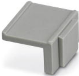
Device marking label, width: 12 mm, area: 12 x 8 mm, e.g. for EML(10x7) R adhesive marking material

Please be informed that the data shown in this PDF Document is generated from our Online Catalog. Please find the complete data in the user's documentation. Our General Terms of Use for Downloads are valid ( http://phoenixcontact.com/download )