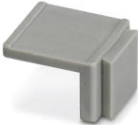
Equipment marker, narrow

Please be informed that the data shown in this PDF Document is generated from our Online Catalog. Please find the complete data in the user's documentation. Our General Terms of Use for Downloads are valid ( http://phoenixcontact.com/download )