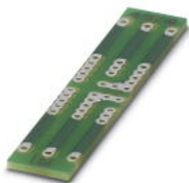
PCB for assembling electronic components

Please be informed that the data shown in this PDF Document is generated from our Online Catalog. Please find the complete data in the user's documentation. Our General Terms of Use for Downloads are valid ( http://phoenixcontact.com/download )