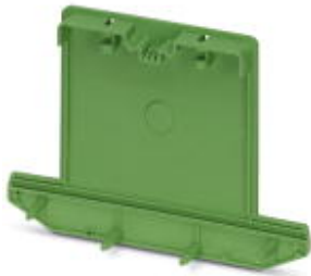
Side element, tall version, for closing both ends of the base element UM-BEFE, for 73 mm wide U-shaped profile cover

Please be informed that the data shown in this PDF Document is generated from our Online Catalog. Please find the complete data in the user's documentation. Our General Terms of Use for Downloads are valid ( http://phoenixcontact.com/download )