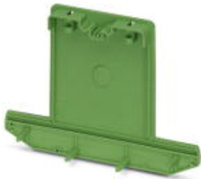
Side element, tall version, for closing both ends of the base element UM-BEFE, for 60 mm wide U-shaped profile cover

Please be informed that the data shown in this PDF Document is generated from our Online Catalog. Please find the complete data in the user's documentation. Our General Terms of Use for Downloads are valid ( http://phoenixcontact.com/download )