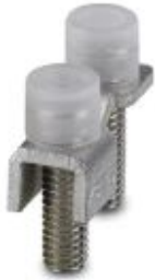
Cross connector/bridge, number of positions: 2, color: silver

Please be informed that the data shown in this PDF Document is generated from our Online Catalog. Please find the complete data in the user's documentation. Our General Terms of Use for Downloads are valid ( http://phoenixcontact.com/download )