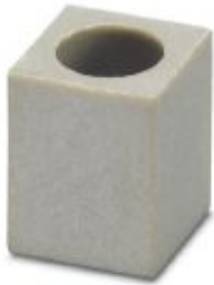
Bridge bar isolator, color: beige

Please be informed that the data shown in this PDF Document is generated from our Online Catalog. Please find the complete data in the user's documentation. Our General Terms of Use for Downloads are valid ( http://phoenixcontact.com/download )