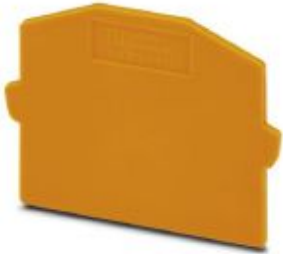
Partition plate, length: 44 mm, width: 1.5 mm, color: orange

Please be informed that the data shown in this PDF Document is generated from our Online Catalog. Please find the complete data in the user's documentation. Our General Terms of Use for Downloads are valid ( http://phoenixcontact.com/download )