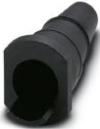
Bend protection sleeve, for cable diameter of 3 mm ... 9 mm, diameter: 12 mm, color: black

Please be informed that the data shown in this PDF Document is generated from our Online Catalog. Please find the complete data in the user's documentation. Our General Terms of Use for Downloads are valid ( http://phoenixcontact.com/download )