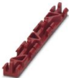
Coding plates, color: red

Please be informed that the data shown in this PDF Document is generated from our Online Catalog. Please find the complete data in the user's documentation. Our General Terms of Use for Downloads are valid ( http://phoenixcontact.com/download )