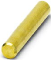
Connection pin, for engaging several base elements to form one unit; 12 necessary per element.

Please be informed that the data shown in this PDF Document is generated from our Online Catalog. Please find the complete data in the user's documentation. Our General Terms of Use for Downloads are valid ( http://phoenixcontact.com/download )